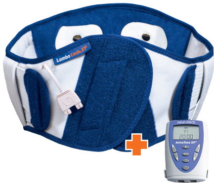
LUMBOTECH XP MET EMS/TENS-FUNCTIE