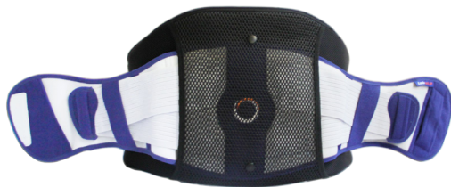
LUMBOTECH MET VERSTEVIGING